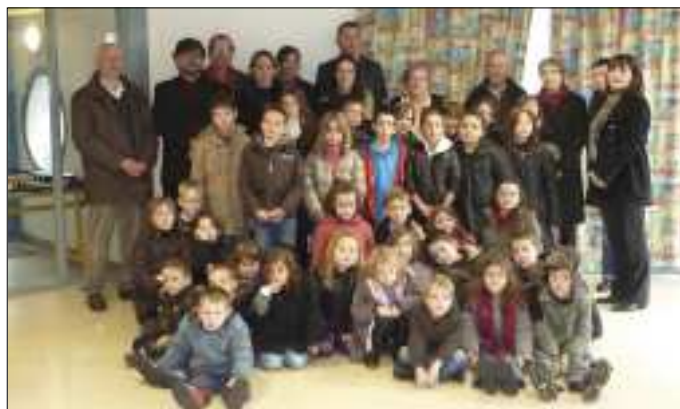
Les occitans de ADOC12 - lengo nostro.

En partenariat avec l'association « Variétés 12 » le réseau d'école, avec les enfants a planté un pommier dans l'espace jeux.