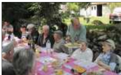
Repas du village de Falies.