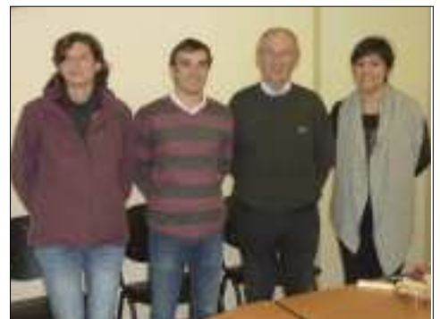
L'équipe du secrétariat.

lundi, mardi, jeudi, le matin de 9 à 12 heures, l'après-midi de 14 à 16 heures vendredi, le matin de 9 à 12 heures.