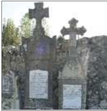
Tombeau des prêtres et de Melle Angelvy.

La création d'un columbarium avec jardin du souvenir est à l'étude pour 6 à 8 places.