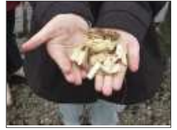
Le produit broyé.

Au mois de février nous avons procédé avec l'entreprise Vignau à l'élagage, des tilleuls de la place et de la presqu'île de Laussac. Nous avons voulu répondre à deux objectifs, pérenniser ces arbres - en 2002 l'un s'est abattu de toute sa hauteur - et assurer la sécurité des riverains. Notre démarche s'est inscrite dans le développement durable car l'ensemble du bois a été broyé et transformé en plaquette pour le chauffage de l'hôpital d'Aurillac.