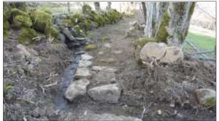
Chemin du Fieu à Crouzet.