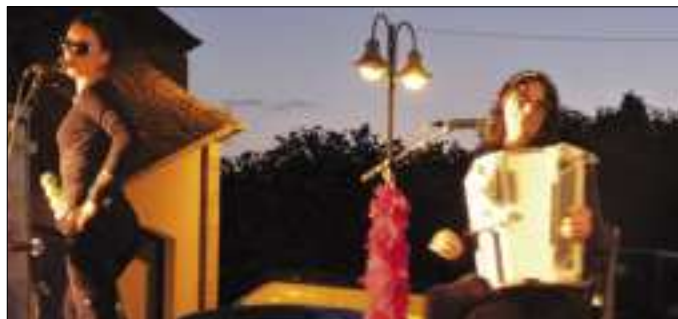
« Délinquante »