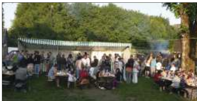
La buvette de la fête des Sentiers