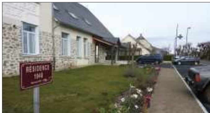
Au devant de la Résidence 1948.