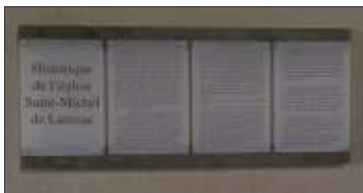
Panneau sur l'historique de l'église de Laussac.

Le cabinet de Thérondels est pris en compte.