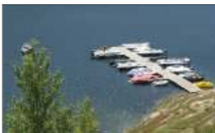
Le ponton communautaire.