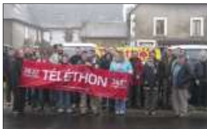
Les 4 x 4 oeuvrent pour le Téléthon.