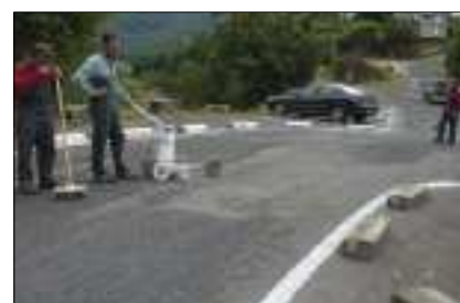
Préparation du stationnement.