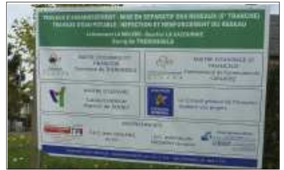
Panneau d'information et de partenariat.

Soit 216 500 € pour la commune et 110 000 € pour la communauté.