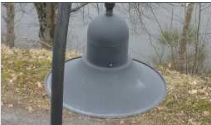
Un éclairage tant attendu.

Pour Laussac, finir l'éclairage est un impératif. Améliorer la circulation et le stationnement devrait être possible, mais avant tout nous avons des urgences, des murs à remonter ou à consolider.