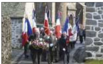
Comité cantonal de la FNACA le samedi 19 mars.