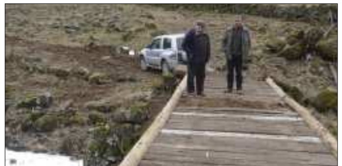
Le pont de Masse sécurisé.