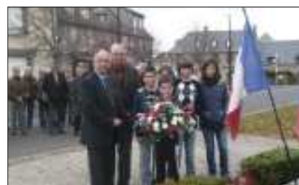
Célébration du 11 novembre.