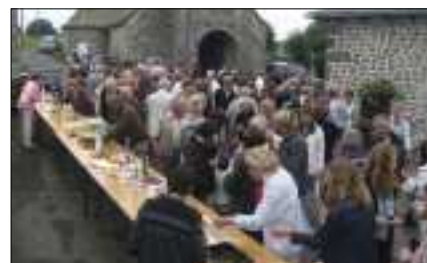
Suivi d'un temps convivial le 3 août.