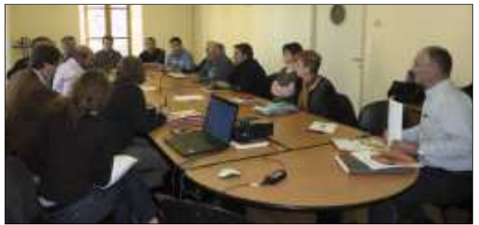
Réunion de travail PLU.