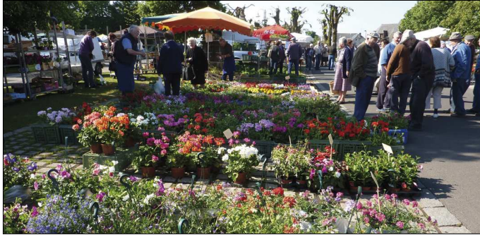
Des fleurs à volonté.

Autour de la foire exposition de tracteurs et matériel agricole,