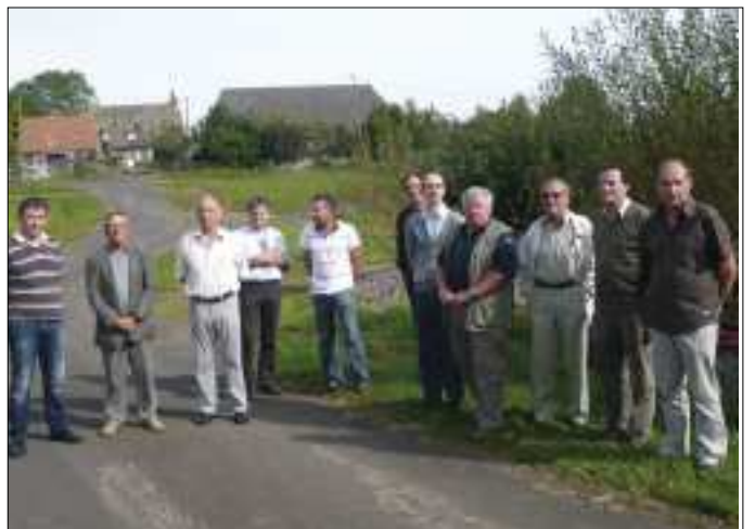
Réception de chantier.