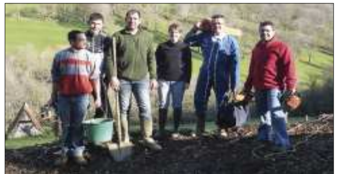
Les bénévoles du moto club.