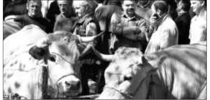
Animaux exposés sur le foirail.

Thérondels a retrouvé un grand temps fort au printemps, l'édition 2012 devrait connaître une foire encore plus festive et importante puisque le 20 mai tombe cette année un dimanche. Un grand rendez-vous à marquer déjà sur vos calendriers !!!