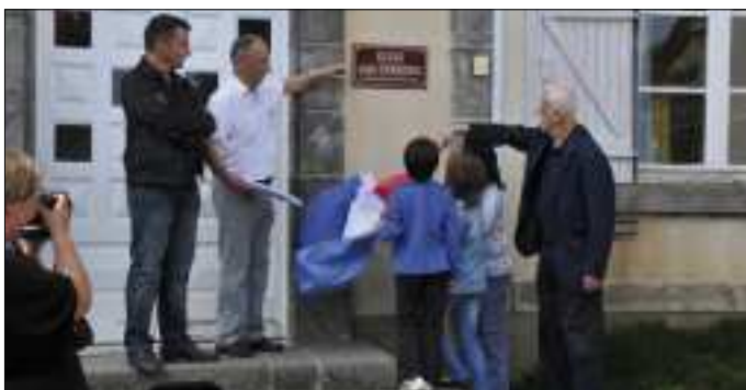
Lors du dévoilement de la plaque.