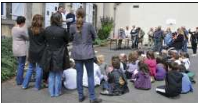
Les enfants et le public.