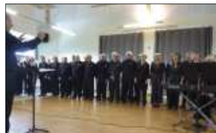
La Chorale Mélodie en Barrez le 21 août.