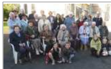
Repas de quartier sud de Théronnels lors de la fête des voisins.