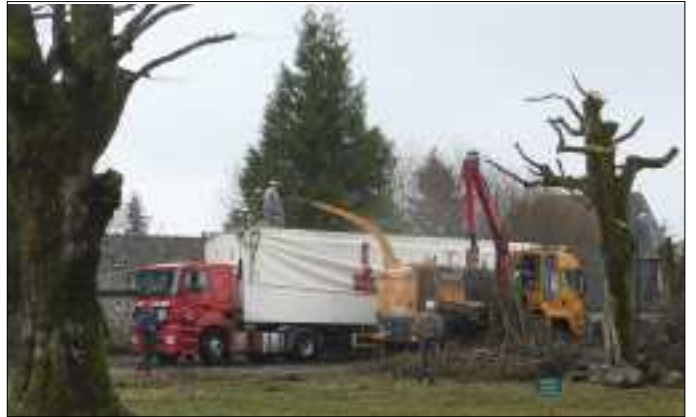
La broyeuse en action.