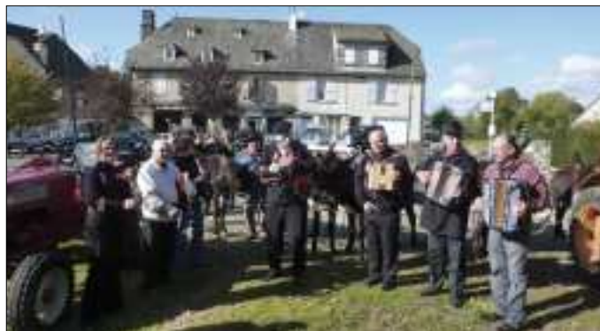
Cabrettes et accordéons autour de l'âne.

Durant la soirée, les 90 convives ont ainsi pu échanger et faire quelques pas de danse au son de la cabrette et de l'accordéon.