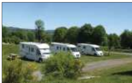
Les campings caristes à la Cazournie.