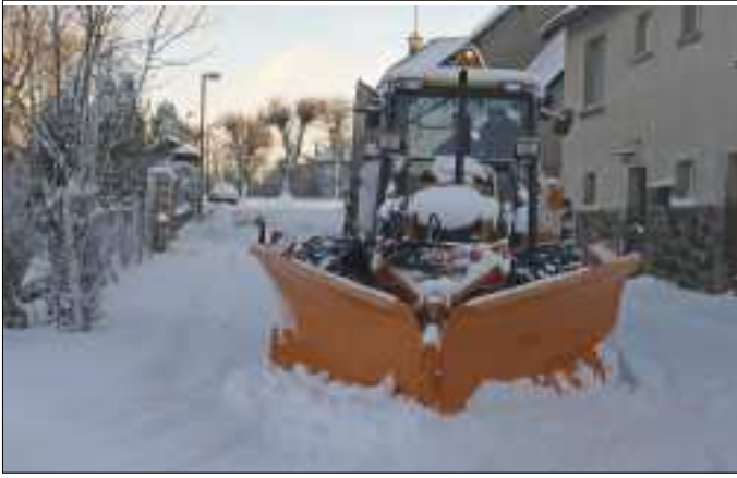
La lame biaisée qui équipait notre tracteur est remplacée par une étrave qui facilitera le travail dans les rues.