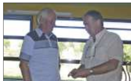
Remise des médailles au Président Mayonade.