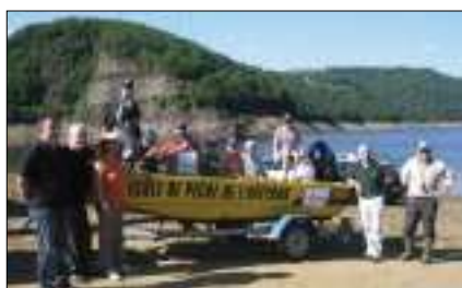
L'école de pêche de l'AAPPMA.