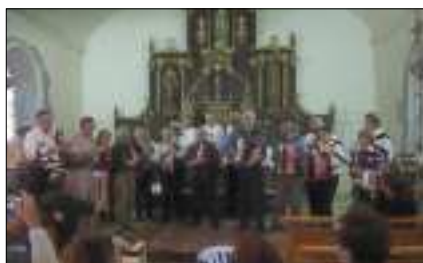
Cabrettes et accordéons de Pailherols en concert à Doux Albats.