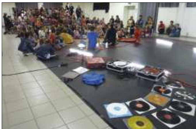
La compagnie Divergence dialogue avec son public.

Fin septembre le groupe Divergence était en résidence à Thérondels, au bénéfice des enfants du réseau d'école, et produisait deux spectacles « Le petit chaperon rouge ».