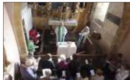
Visite de la paroisse Saint-Gaubert à Laussac.