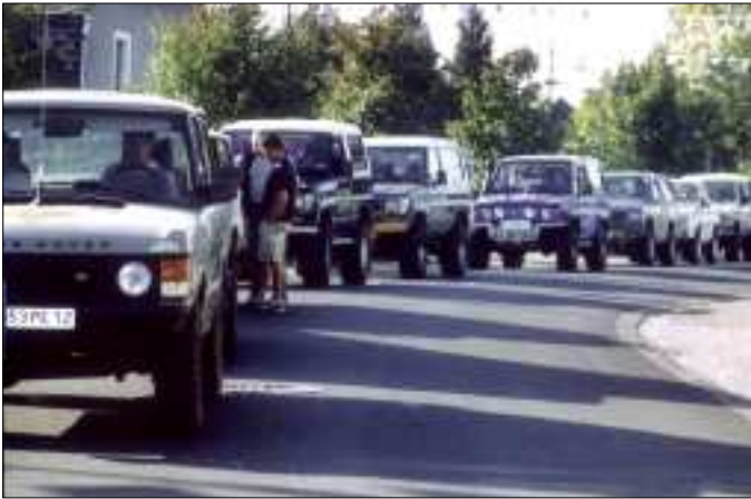
La Ronde des 4x4 : le groupe présidé et animé par Thérondels Automobiles