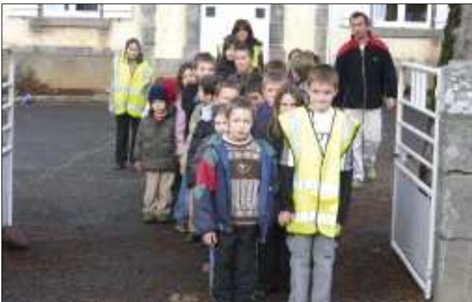
Opération sécurité avec Groupama pour le trajet journalier vers la cantine