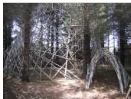
La fourmière géante