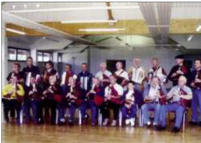
Cabrettes et accordéons se sont accordés sur quelques morceaux choisis