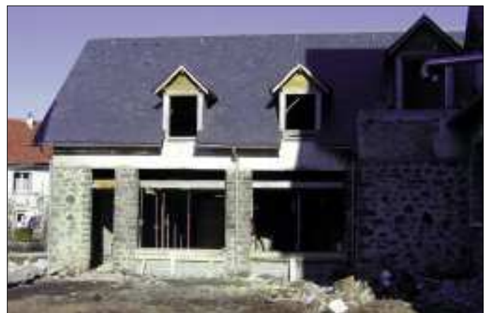
Maison mitoyenne orientée Sud-Ouest