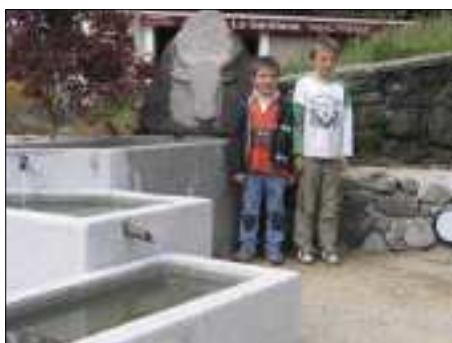
La nouvelle fontaine sur la place

Les aménagements de l'espace Cazournie avec déplacement de la borne camping-car et plantations d'arbustes et vivaces sont réalisés par les entreprises Froment, Pinquier.