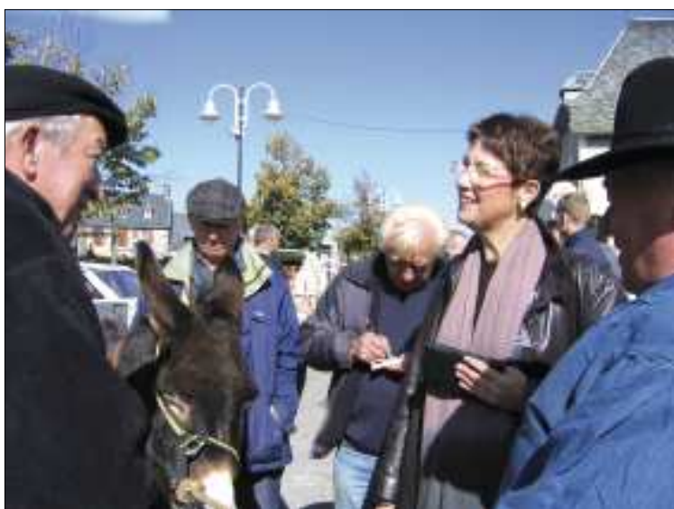
Vente de tickets pour la pesée de l'âne

Il est envisagé d'organiser un concours de belote au printemps prochain.