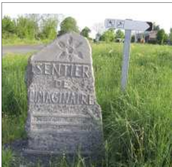
Borne de balisage

Les Entreprises Froment, Poujouly, Roques ont réalisé la Fontaine sur la place. La sculpture est de Jean Mayonade, la plantation d'Eric Vayrac, tous deux bénévoles.