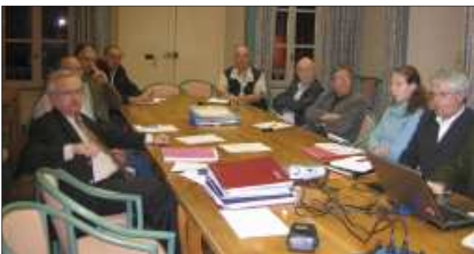
Réunion syndicat mixte du Lac de Sarrans