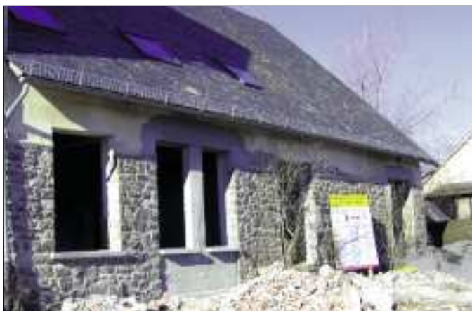
Façade Est du futur cabinet médical