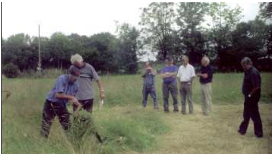
Traditionnel concours de fauchage à Nigresserre.