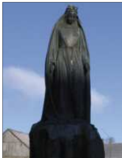
Statue en bronze de la Vierge, œuvre de René Merolle - 1951 - (Fonds national d'art contemporain)