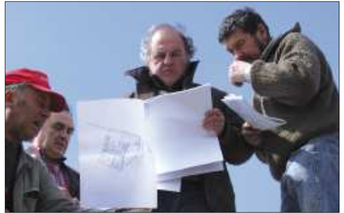
Réflexion sur le chantier HLM