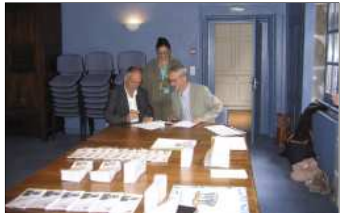
Signature des prêts à poster avec la Poste en présence de Mme Ieffa et de M. Cluzel