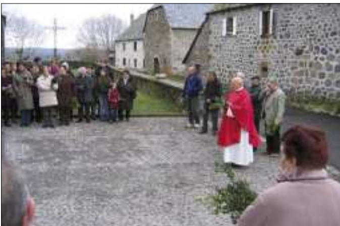
Bénédictio des Rameaux