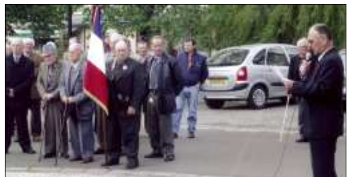
Cérémonie du 8 Mai en présence des anciens combattants