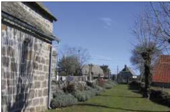
Un village propre, accueillant et fleuri tout au long de l'année

L'association de Sauvegarde du Patrimoine de Ladinhac a tenu son assemblée générale courant mai.